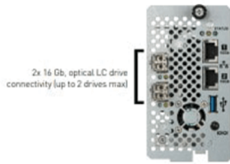
2x 16 Gb, optical LC drive connectivity (up to 2 drives max)