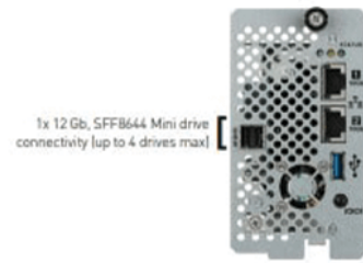
1x 12 Gb, SFFB644 Mini drive connectivity (up to 4 drives max)